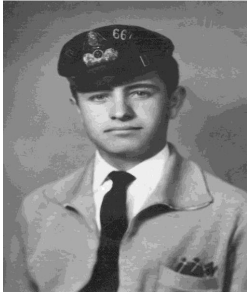
Έτος 1957. Μαθητής Γυμνασίου με το πηλήκιο. Διακρίνεται στη μέση η κορώνα και στο πλάι ο αριθμός του μαθητή.

Η αξιολόγηση των μαθητών με αυτόν τρόπο καταργήθηκε με νόμο το 2017, αλλά φαίνεται να επανέρχεται με το σχέδιο νόμου του 2020. Το πηλήκιο δεν έπρεπε να είναι παραποιημένο (πιεσμένο στο πλάι ή μη εμφανής ο αριθμός κτλ.). Απαγορεύονταν: η κυκλοφορία μετά τις 7 το βράδυ, τα πάρτι, ο κινηματογράφος, μη κόσμια ντυμένος (ξεκούμπωτος). Όπως έλεγαν τουλάχιστον τότε στο στρατό "εθεάθη αποκεκομβιωμένος κατά ένα κομβίο". Οι μαθήτριες με ποδιά ορισμένου χρώματος (συνήθως μπλε με άσπρο γιακά) και ορισμένου μήκους (οπωσδήποτε κάτω από το γόνατο).