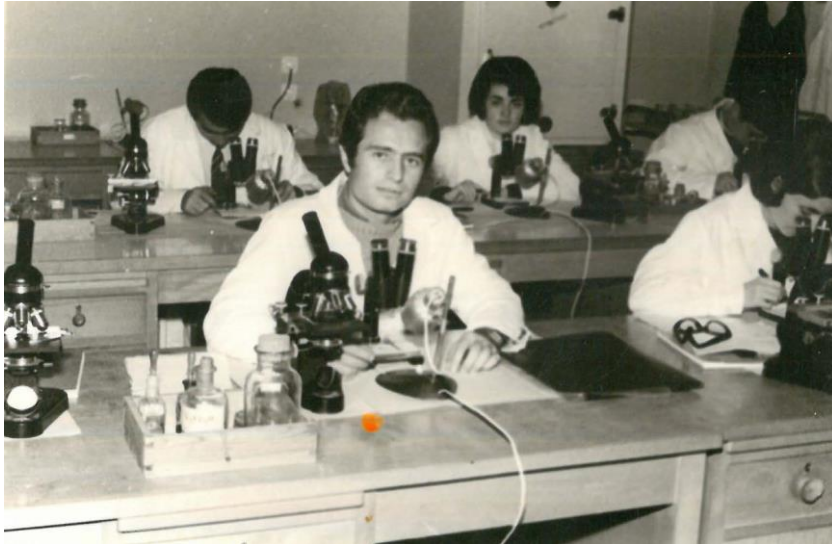
Έτος 1966. Φοιτητές του Φυσιογνωστικού Τμήματος κατά τη διάρκεια εργαστηριακής άσκησης Βιολογίας.

Για κάποια μαθήματα υπήρχαν εξωπανεπιστημιακά φοιτητικά φροντιστήρια, στα οποία δίδασκαν άτομα από το Βοηθητικό Διδακτικό Προσωπικό και υπήρχε η φήμη ότι βαθμολογούσαν οι ίδιοι. Συνεπώς, η βαθμολόγηση θα ήταν ευνοϊκότερη.