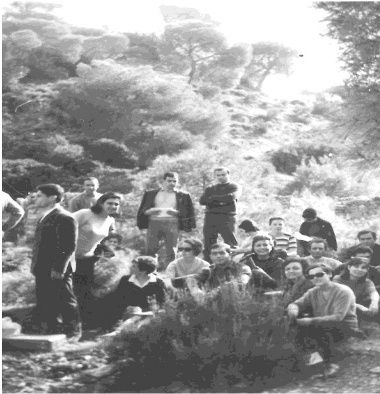
Έτος 1968. Φοιτητές του Φυσιογνωστικού Τμήματος κατά τη διάρκεια υπαίθριας άσκησης Γεωλογίας.

Στα Εργαστήρια οι φοιτητές έπρεπε να φοράνε υποχρεωτικά ιατρική μπλούζα. Όποιος δε φορούσε δε γινόταν δεκτός.